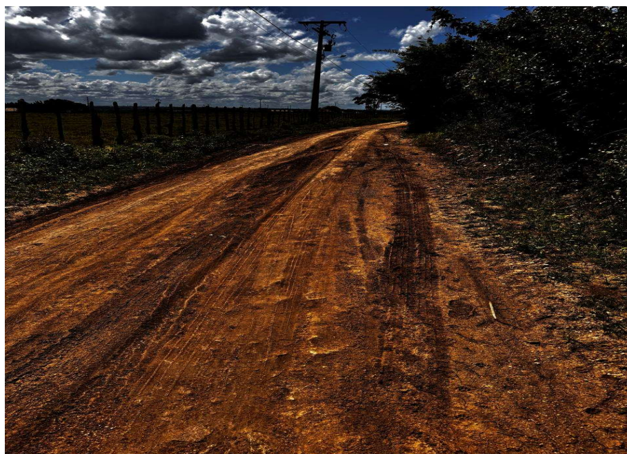
Lançamento de solo argiloso

PREFEITURA MUNICIPAL DE CONCEIÇÃO DA FEIRA - BAHIA CNPJ: 13.828.371/0001-08 RUA MARECHAL DEODORO DA FONSECA, Nº 26 - CENTRO CEP: 44.320-000