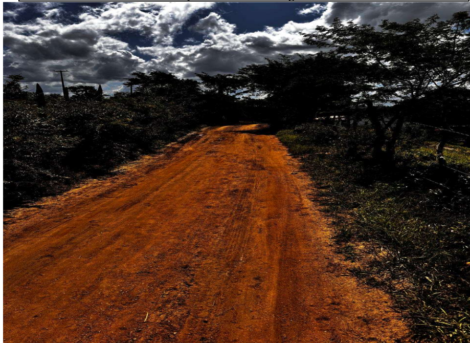
Lançamento de solo argiloso

PREFEITURA MUNICIPAL DE CONCEIÇÃO DA FEIRA - BAHIA CNPJ: 13.828.371/0001-08 RUA MARECHAL DEODORO DA FONSECA, Nº 26 - CENTRO CEP: 44.320-000