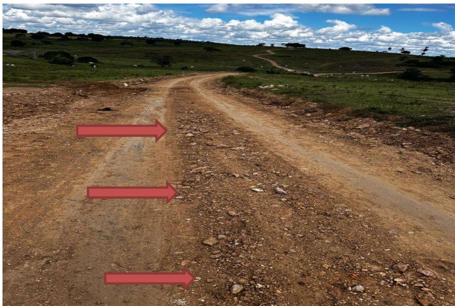
Trecho sem compactação