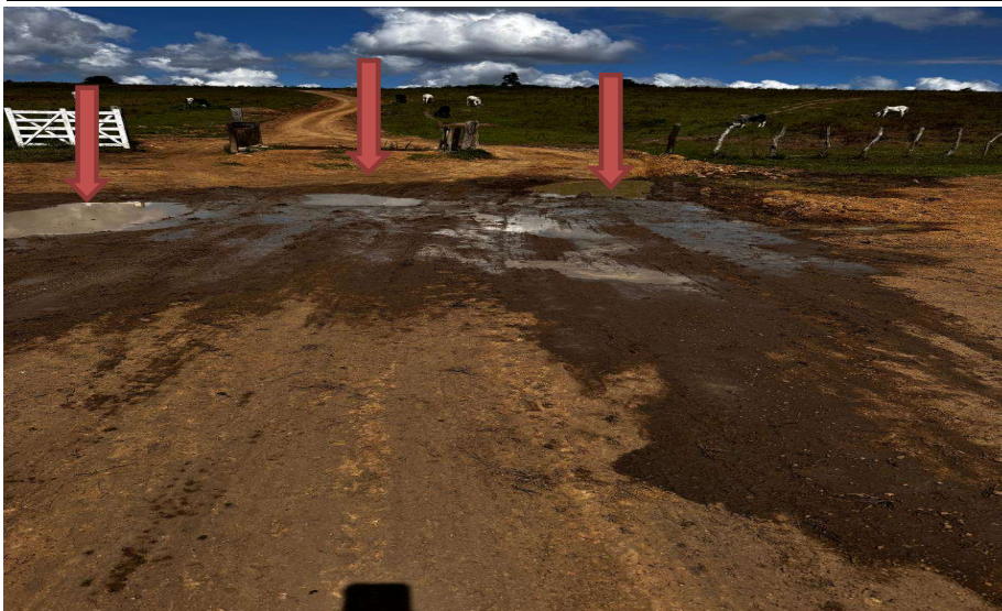
Trecho sem compactação

PREFEITURA MUNICIPAL DE CONCEIÇÃO DA FEIRA - BAHIA CNPJ: 13.828.371/0001-08 RUA MARECHAL DEODORO DA FONSECA, Nº 26 - CENTRO CEP: 44.320-000