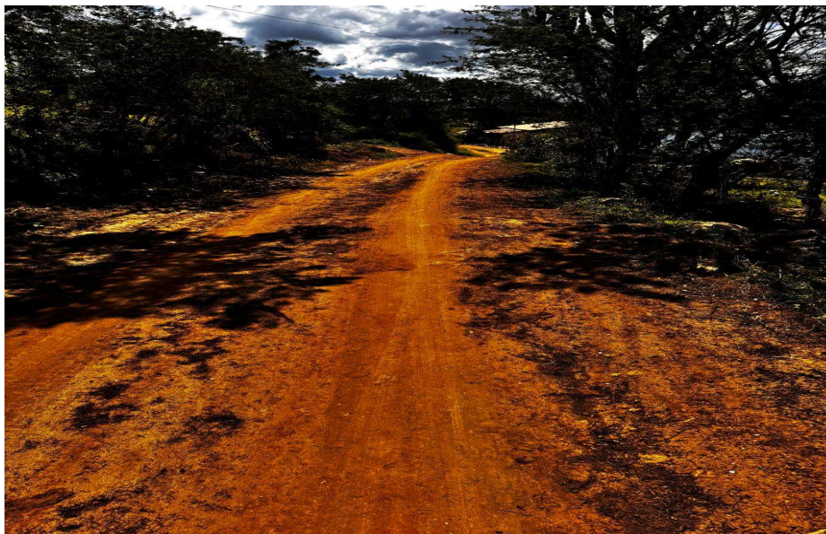
Lançamento de solo argiloso

PREFEITURA MUNICIPAL DE CONCEIÇÃO DA FEIRA - BAHIA