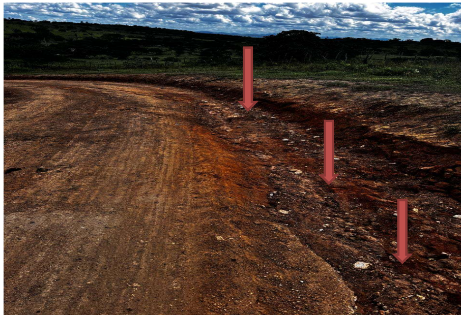
Trecho sem compactação

PREFEITURA MUNICIPAL DE CONCEIÇÃO DA FEIRA - BAHIA CNPJ: 13.828.371/0001-08 RUA MARECHAL DEODORO DA FONSECA, Nº 26 - CENTRO CEP: 44.320-000