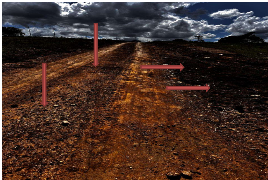
Trecho sem compactação

PREFEITURA MUNICIPAL DE CONCEIÇÃO DA FEIRA - BAHIA