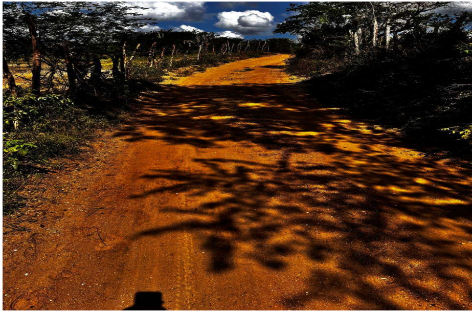
Lançamento de solo argiloso

PREFEITURA MUNICIPAL DE CONCEIÇÃO DA FEIRA - BAHIA